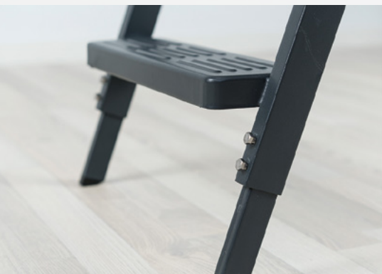
Metalstige med dybe trin