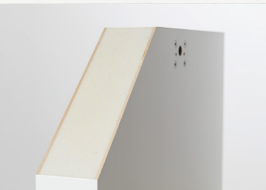
70 mm PUR isolering